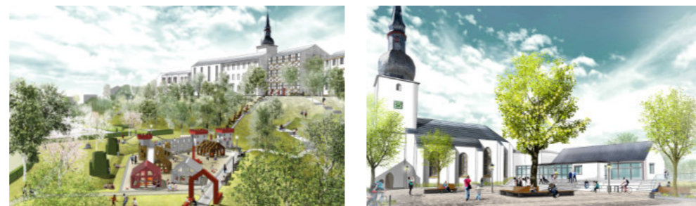
So könnte es aussehen! Quelle: Wüdrich Landschaftsarchitekten, Düsseldorf

Ein wichtiges Ziel ist, öffentliche Plätze und Grünflächen neu und attraktiv zu gestalten und die Erreichbarkeit der Altstadt von der Innenstadt aus zu verbessern. 2019 wurde ein „Masterplan Grün“ in der dritten Stadtteilkonferenz diskutiert. Die Grundidee der Planung ist eine harmonische Gestaltung im Sinne einer „Stadt für alle“, die die Wohn- und Lebensqualitäten des Quartiers für verschiedene Nutzergruppen stärkt.