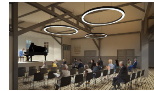
So könnte es aussehen! Quelle: Hillnhütter Architekten, Reichshof