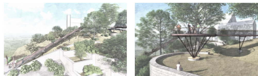
So könnte es aussehen! Quelle: Bonfanti Architekten, Wiehl

Um die direkte Verbindung zwischen der Altstadt und der Stadtmitte für mobilitätseingeschränkte Personen, aber auch für Familien und Gäste mit Fahrrädern etc. zu erleichtern, wurden unterschiedliche Alternativen diskutiert. Als geeignete Variante für eine direkte und barrierearme Verbindung wurde ein Schräglift mit flankierender großzügiger Treppenanlage eingestuft. Das Bauwerk wird am Schmittloch platziert werden, um eine direkte Verbindung zum Geschäftsbereich Kölner Straße und zum Omnibusbahnhof zu ermöglichen. Dieser „Brückenschlag Altstadt Stadtmitte“ soll dabei als Leuchtturmprojekt mit einer filigranen Aussichtsplattform eine besondere Gestaltung erfahren.